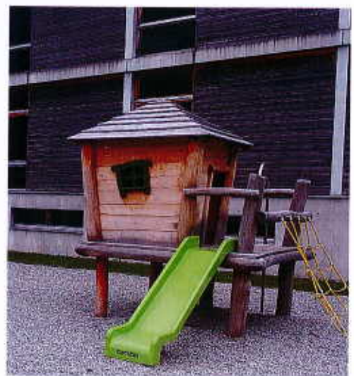
Neuer Spiel- und Begegnungsplatz